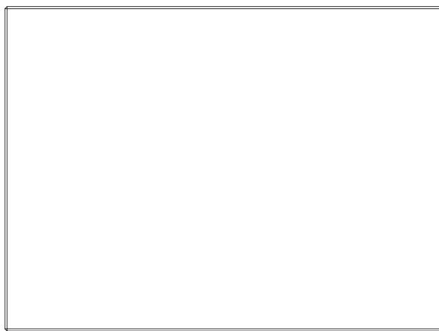
Widok z frontu